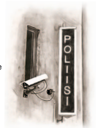
Keskusrikos- poliisin lyhenne